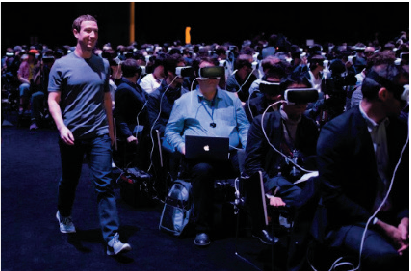
Mark Zuckerberg davant la desatenta mirada del seu públic.

Una multitud d'éssers sols. En aquest món especular, la llibertat es presenta com una caverna amb finestres digitals. Com els hikikomoris, podem estar tranquils de que no hi haurà cap irrupció del real. Podríem dir que l'efecte panòptic que comporta la comunicació digital constreny el que tenim d'humà. És impossible explicar-se a través dels mitjans digitals perquè aquest només tenen una narració additiva, comptable i transparent, mentre que la veritat (entesa a la manera heideggeriana) es presenta com una ocultació. Per tant, a la pura positivitat, exterioritat, transparència i desig d'eficiència dels temps digitals, els hi manca veritat. Seguint una metàfora heideggeriana, Byung-Chul Han afirma que l'ésser humà ha passat de ser llaurador (amb virtuts com la paciència, renúncia, despreniment, recel, compte) a ser caçador d'instant, perdent amb el canvi les característiques essencials que el feien humà. Les Google glass i les ulleres immersives es presenten com la totalització de l'òptica del caçador. Neguen tot allò que no sigui informació perdent així el gaudi més profund de la percepció: la manca d'eficiència. En aquest sentit, recordo que a l'últim Mobile World Congress celebrat a Barcelona, ningú no va veure l'entrada de Mark Zuckerberg perquè tothom duia posades les ulleres immersives de Samsung.